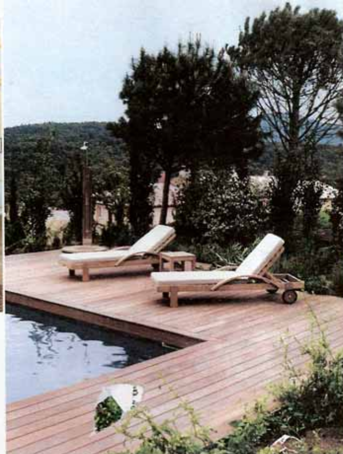
CI-CONTRE : Piscine et chaises longues dans un cadre de rêve. Teintes et matériaux naturels prédominent dans un souci d'authenticité.